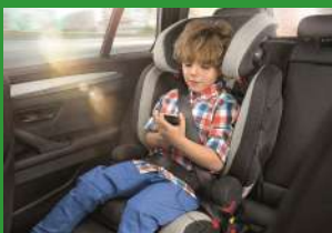
Автокресло группы II и III (для детей массой 15–36 кг)