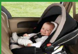
Автокресло группы 0+ (для детей массой < 13 кг)*