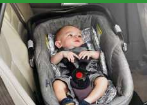
Автокресло «люлька» группы 0 (для детей массой < 10 кг)*

При покупке детского удерживающего устройства обязательно следует уточнить у продавца наличие сертификата на товар!