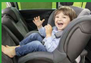
Автокресла групп I (для детей массой 9–18 кг)*